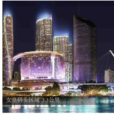
女皇码头区域 3.3公里

Bicentennial自行车道 300米 图旺纪念公园 600米 布里斯班植物园 2公里 布里斯班市政花园 3.7公里